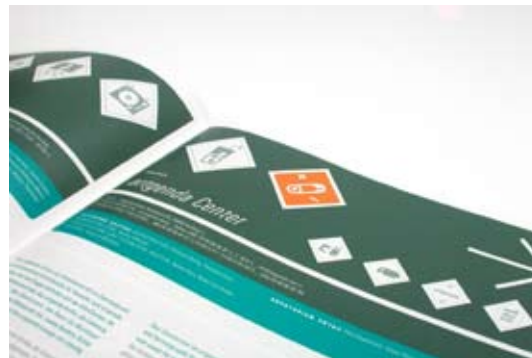
links Innenseiten Programmheft