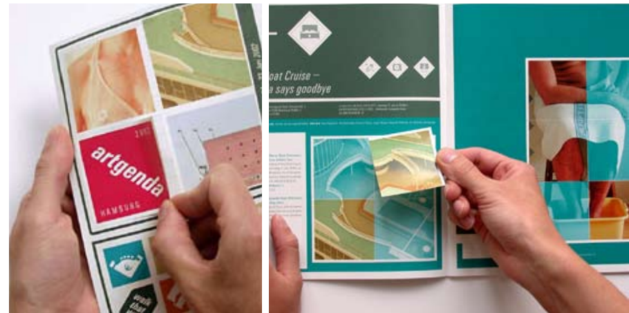
links Flyer (Aufklebersets)